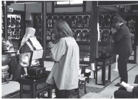
役目を終えた入れ歯に焼香する