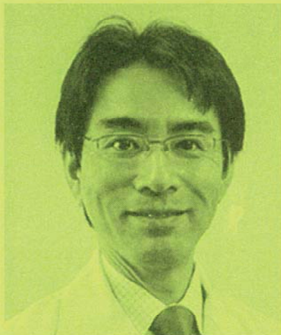
(九州大学医学部 眼科 教授)