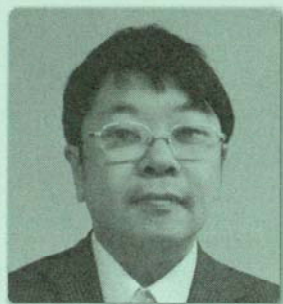
あおぞらクリニック院長・みやき町 日本糖尿病学会専門医・指導医