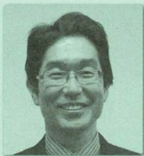
医療法人へのうえ市丸歯科院長 鳥栖市 日本歯周病学会専門医・指導医